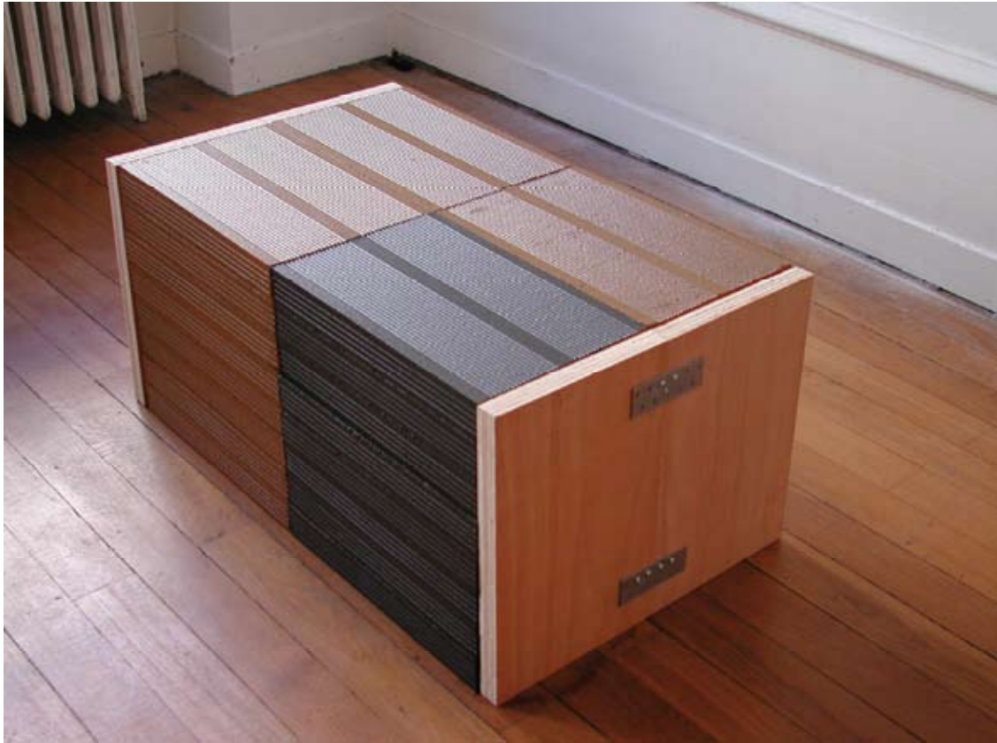
Eperlecques, 2009, contreplaqué, briques, peinture acrylique, platines, silicone, 85,5 x 50 x 40 cm

Eperlecques, c'est le nom d'un village dans la région du Nord-Pas-de-Calais abritant l'un des plus grands blockhaus construit par les Allemands durant la Seconde Guerre Mondiale. Celui-ci a servi à héberger une base de construction et de lancement des fusées V1 et V2 qui permirent de précipiter la conquête spatiale. En scellant cette pièce avec des plaques de contreplaqué, l'artiste choisit d'annuler visuellement l'une des caractéristiques du module en brique - les alvéoles - avec lequel elle travaille depuis plusieurs années, de sorte que l'on perd une des particularités formelles et utilitaires du matériau. Libérée de celle-ci, Eperlecques s'ancre au sol de toute sa densité.