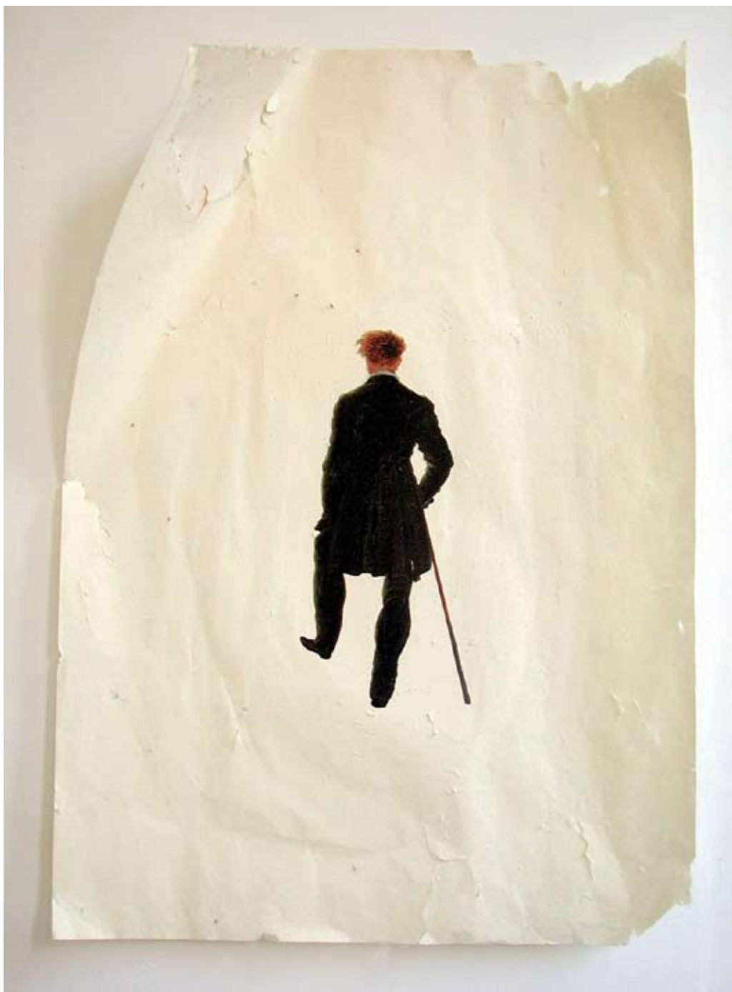
Le Promeneur , 2003-2010, carte postale agrandie et grattée, 105 x 150 cm

Le Promeneur , Les Raboteurs de parquet et Le Tub sont issus d'une série de travaux initiée en 2003 et poursuivie en 2010 qui consiste à choisir des reproductions de chefs-d'oeuvres picturaux sous forme de cartes postales et d'en soustraire par effeuillage et grattage certains éléments pour ne garder qu'une partie du tableau. La nouvelle composition ainsi obtenue révèle alors un nouveau sens, une nouvelle lecture de l'oeuvre.