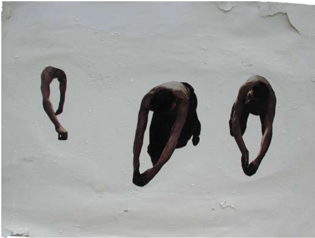
Les raboteurs de parquet, 2003-2010, carte postale agrandie et grattée, 105 x 150 cm