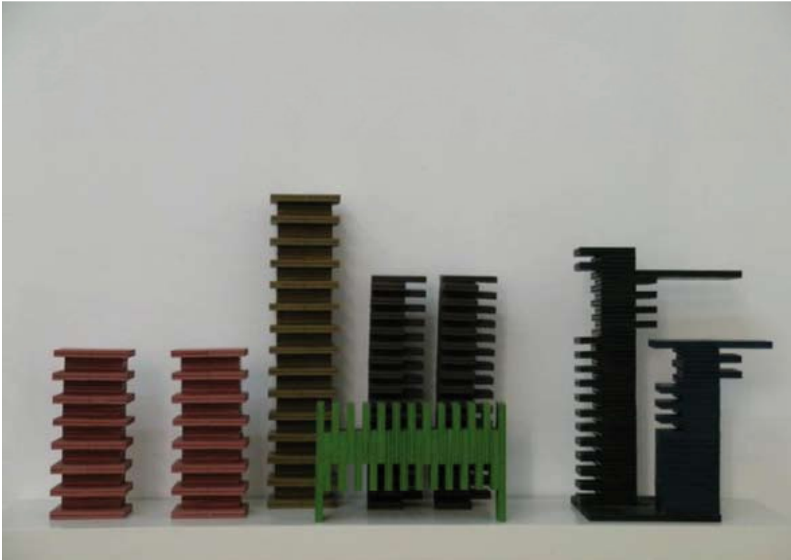
La Forme relevée , 2009-2010, contreplaqué, peinture acrylique, dimensions variables

La Forme relevée est constituée de petites constructions immobilières, à mi-chemin entre maquette architecturale et sculpture peinte, fabriquées à partir de modules en contreplaqué conservant les proportions exactes d'une brique plâtrière. Cette série, qui regroupe des dizaines de modules aux diverses formes, est directement inspirée des premiers grands ensembles construits à Drancy, en région parisienne, au début des années 30 et dont les proportions élevées commencèrent à tutoyer le ciel du haut de leurs 15