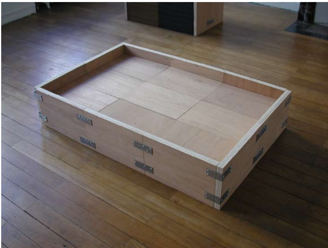
Cofr, 2009, contreplaqué, briques, peinture acrylique, platines, équerres, 126,5 x 81 x 25 cm

Cofr fonctionne comme un coffrage à béton dans lequel on pourrait couler la matière. Ici ce n'est pas du béton que l'on y a déposé mais des plaques de bois qui, rangées côte à côte, recouvrent entièrement la surface.