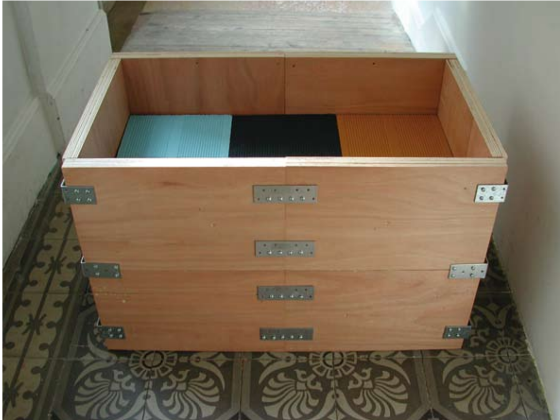
Fortin, 2009, contreplaqué, briques, peinture acrylique, platines, équerres, 81,5 x 46 x 50 cm

Fortin est réalisé en empruntant un certain nombre de gestes et d'outils au monde ouvrier: l'empilement des matériaux, le positionnement orthogonal des briques, l'utilisation d'un coffre comme cadre de référence pour le coulage du béton. Ici, le cadre a été extrudé.